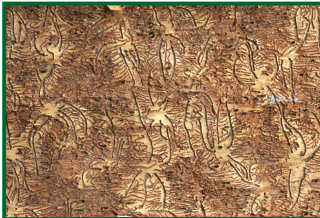
Požerky lýkožrouta lesklého

K odchytům lýkožrouta lesklého jsou vhodné nárazové typy lapačů (šterbinové lapače typu Theysohn nebo křížové lapače typu Ecotrap). Sítko ve šterbinách kontejnerů musí být dostatečně husté, aby nedocházelo