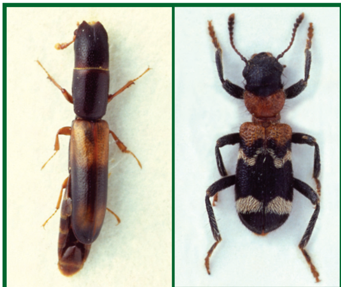
Predátoři lýkožrouta lesklého: vlevo kornatec dlouhý ( Nemozoma elongantum ), zvětšeno 14x, vpravo pestrokrovečník mravenčí ( Thanasimus formicarius ), zvětšeno 9x

Významné jsou i některé druhy dvoukřídlých (např. z rodu Medetera ) a blanokřídlých (např. chalcidka Psychophagus abieticola Ratz. nebo lumčici rodu Spathius , Ecphyllus a Cosmophorus ), jejichž larvy parazitují na vajíčkách, případně larvách I. lesklého. Na dospělých parazitují roztoči (např. Uropoda polysticta Vitzth.) nebo cizopasně hlístice (např. zástupci rodů Panagrolaimus nebo Parasitophelenchus ).