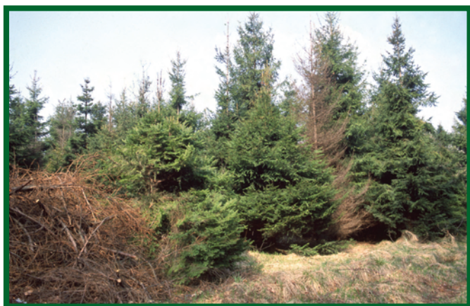
Odstraňování těžebního odpadu je základním preventivním opatřením proti lýkožroutu smrkovému; vpravo na obrázku smrková souše po napadení l. lesklým

k unikání zachycených jedinců. K navnazení se používají odparníky určené k lákání tohoto druhu, které jsou uvedeny v „Seznamu povolených přípravků na ochranu rostlin“, který vydává Ministerstvo zemědělství ČR ve spolupráci se Státní rostlinolékařskou správou Brno, nebo v „Seznamu povolených přípravků na ochranu lesa“, sestavovaného pracovníky VÚLHM Jíloviště-Strnady (tento seznam kopíruje a pro praxi doplňuje výše uvedený seznam), a to podle platných etiket (dále jen „Seznam“). Odparníky se vyvěšují těsně před předpokládaným začátkem rojení, tj. v nižších polohách zpravidla v druhé polovině dubna, ve vyšších polohách poněkud později.