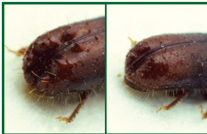
Vlevo zadní část krovek samečka, vpravo samičky lýkožrouta lesklého

Mezi nejvýznamnější predátory lýkožrouta lesklého patří brouk z čeledi Temnochilidae, kornatec dlouhý ( Nemozoma elongatum Latr.). Tento brouk je úzký, válcovitý, takže může snadno prolézat chodbami l. lesklého, kde se živí jeho larvami. V poměrně vysokém počtu bývá nalézán v odchytch l. lesklého v lapačích, kde jeho podíl může činit až 4 % odchytu l. lesklého. Další predátoři z řádu brouků, i když již méně významní, jsou z čeledi střevlíkovitých (Carabidae), drabčíkovitých (Staphilinidae), mršníkovicových (Histeridae), potemníkovitých (Tenebrionidae), pestrokrovecíkovitých (Cleridae), lesknáčekovitých (Nitidulidae) a jim příbuzné čeledi Rhizophagidae.