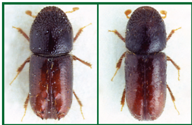
Vlevo sameček, vpravo samička lýkožrouta lesklého (zvětšeno 25x)

Nejčastěji jej nalézáme na smrku ztepilém, ale napadá i některé další druhy smrku (u nás např. smrk pichlavý), dále modřín opadavý, borovici lesní a další borovice – vejmutovka, blatka, kleč, borovice černá.